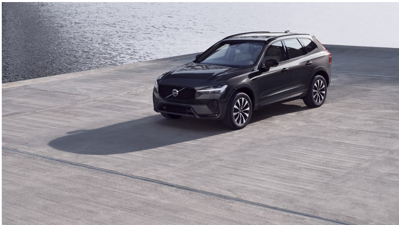
XC60 Dark Plus Exteriér

Pomocí tohoto kódu můžete svůj návrh sdílet s prodejcem Volvo