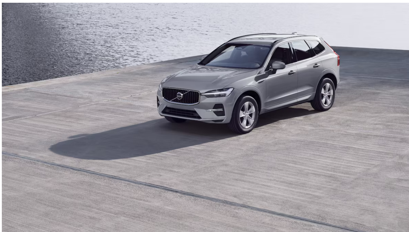
XC60 Core Exteriér

Pomocí tohoto kódu můžete svůj návrh sdílet s prodejcem Volvo