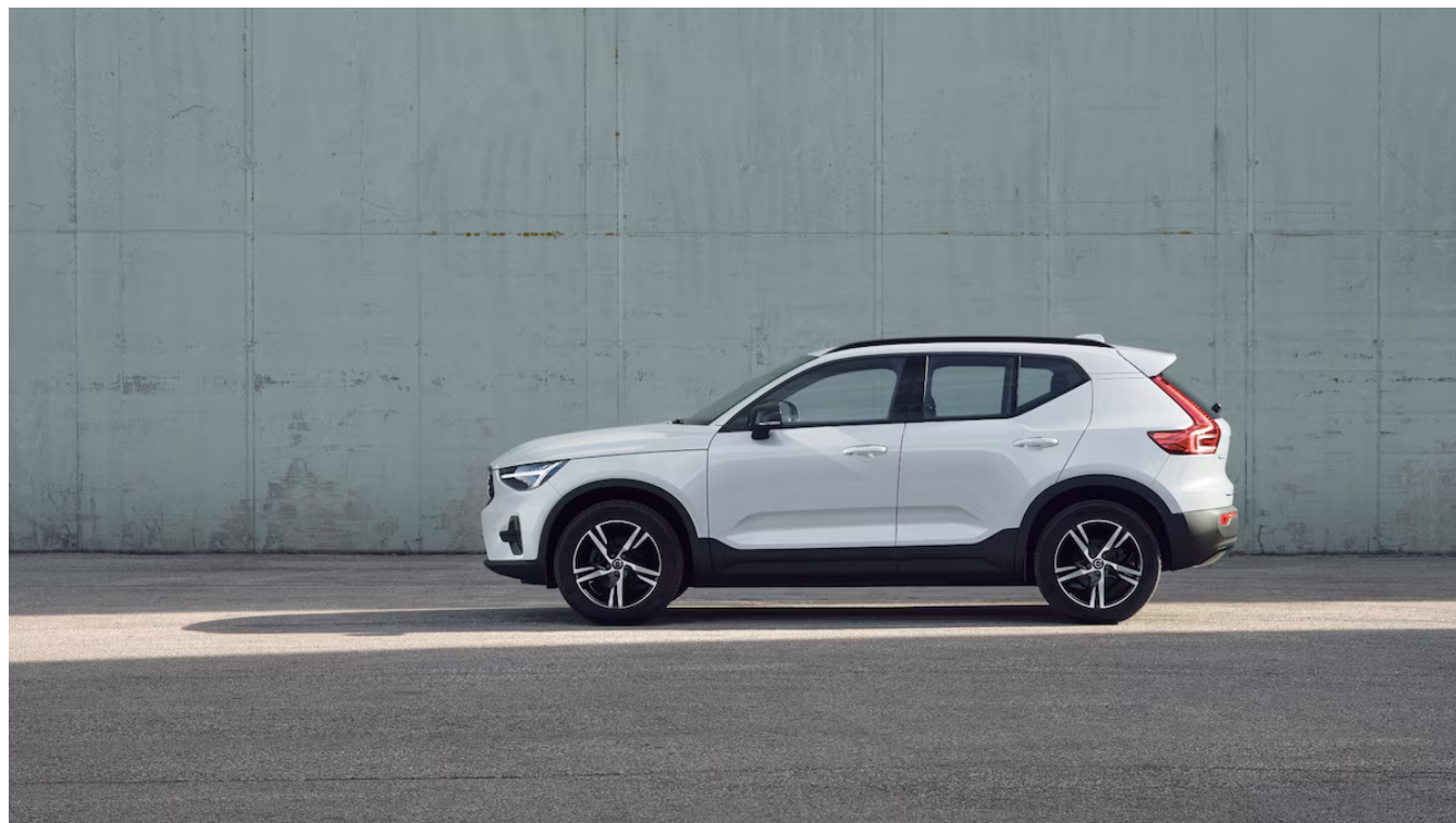
XC40 Dark Plus Exteriér

Pomocí tohoto kódu můžete svůj návrh sdílet s prodejcem Volvo