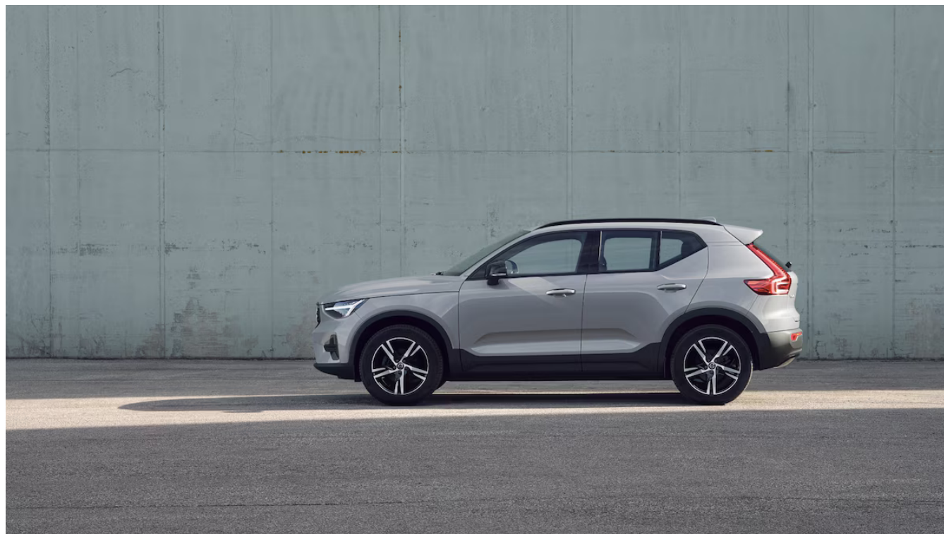
XC40 Dark Plus Exteriér

Pomocí tohoto kódu můžete svůj návrh sdílet s prodejcem Volvo