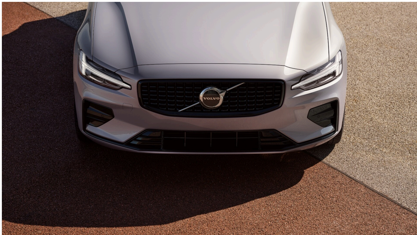
V60 Dark Plus Exteriér

Pomocí tohoto kódu můžete svůj návrh sdílet s prodejcem Volvo