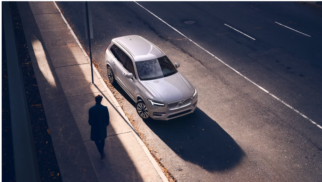
XC90 Recharge Bright Exteriér

Pomocí tohoto kódu můžete svůj návrh sdílet s prodejcem Volvo