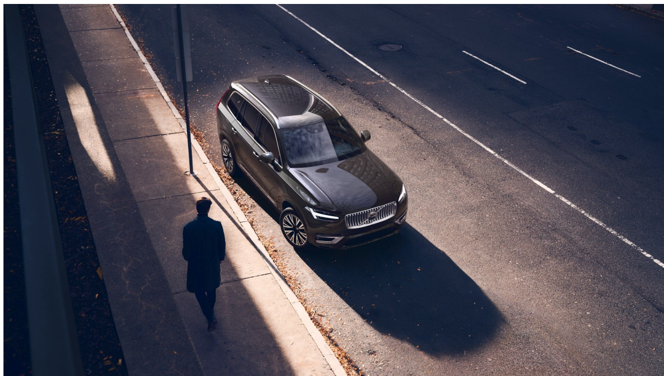
XC90 Recharge Bright Exteriér

Pomocí tohoto kódu můžete svůj návrh sdílet s prodejcem Volvo