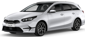
Perleťová Bílá Deluxe (HW2)