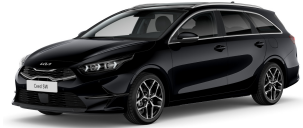
Černá Pearl (1K)