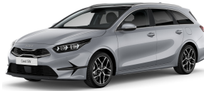
Stříbrná Sparkling (KCS) - není dostupná pro GT-line a PHEV