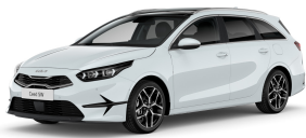
Bílá Cassa (WD)